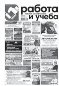
«Робота і навчання» наклад 1 100 примірників