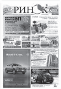
«Ринок Плюс» наклад 50 000 примірників