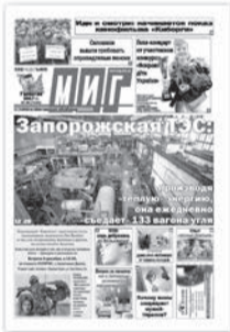
«Міг» наклад 30 000 примірників